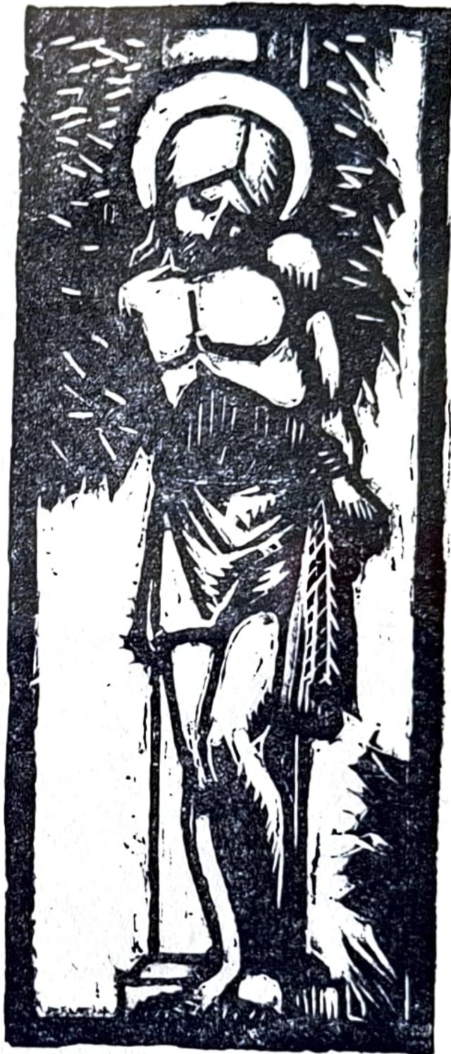
Bois gravé par le P. M. B. Fieullien,